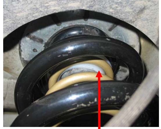
Position de la bague Nylon (2) sur le haut du ressort auxiliaire.